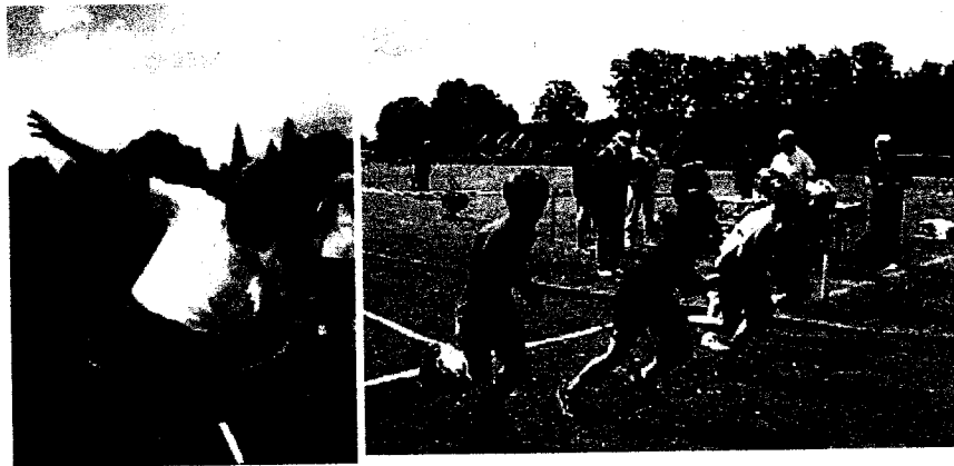
links: Bürgermeister Horst Förther beim Kugelstoßen

Sobald der Termin für den Sportabzeichentag 2006 feststeht, finden Sie hier alle wichtigen Informationen darüber.