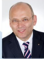
1. Stellvertretender Vorstand Heribert Trunk Präsident der IHK Oberfranken für Bayreuth