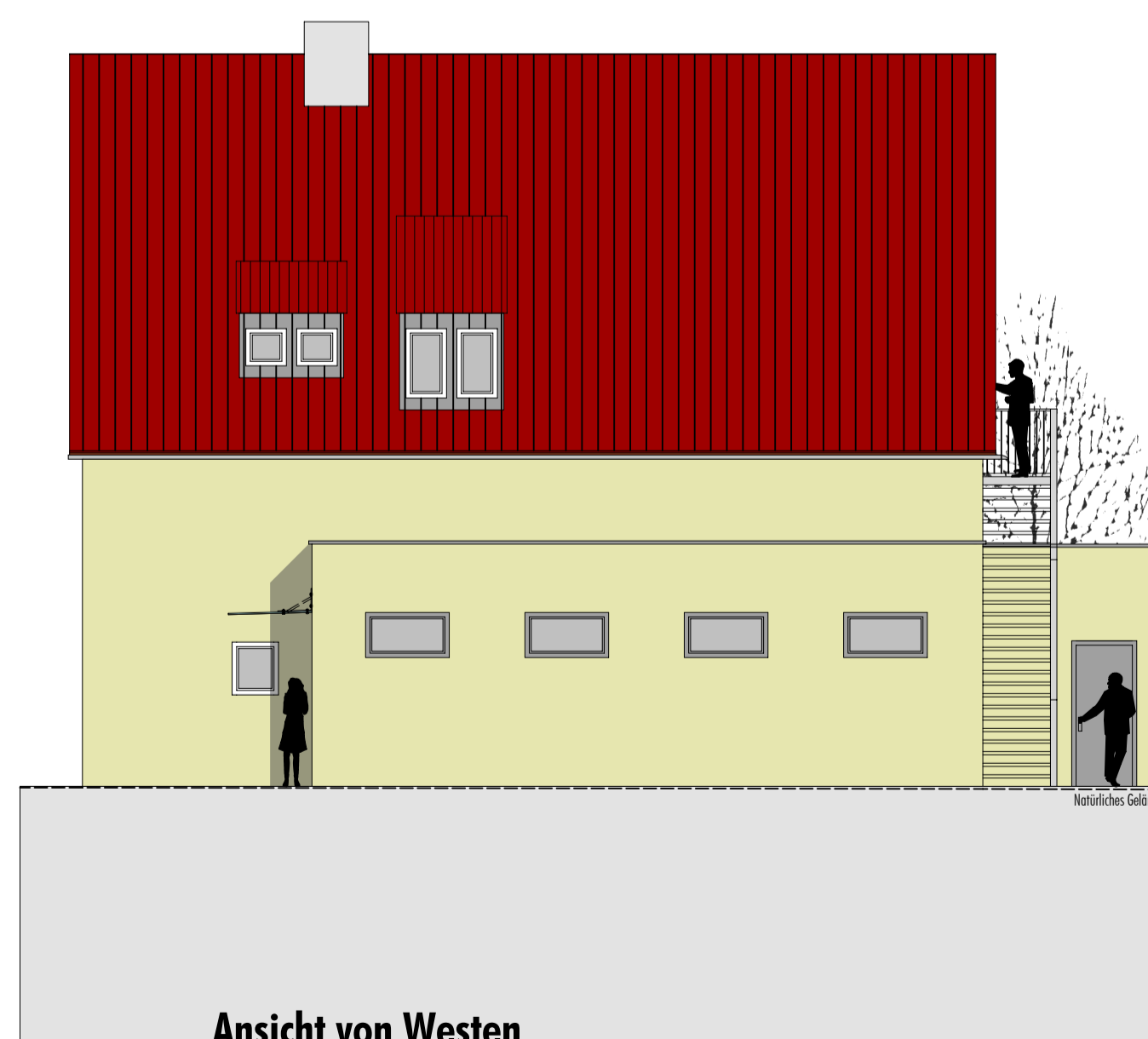
Ansicht von Westen