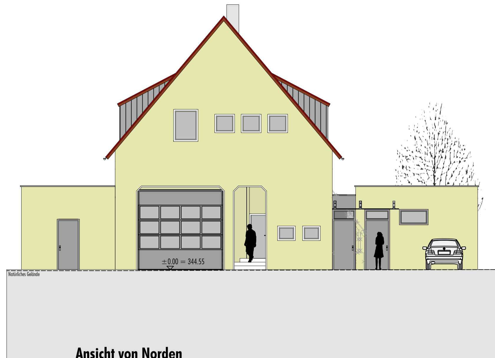
Ansicht von Norden