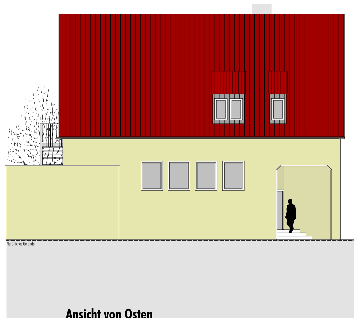
Ansicht von Osten