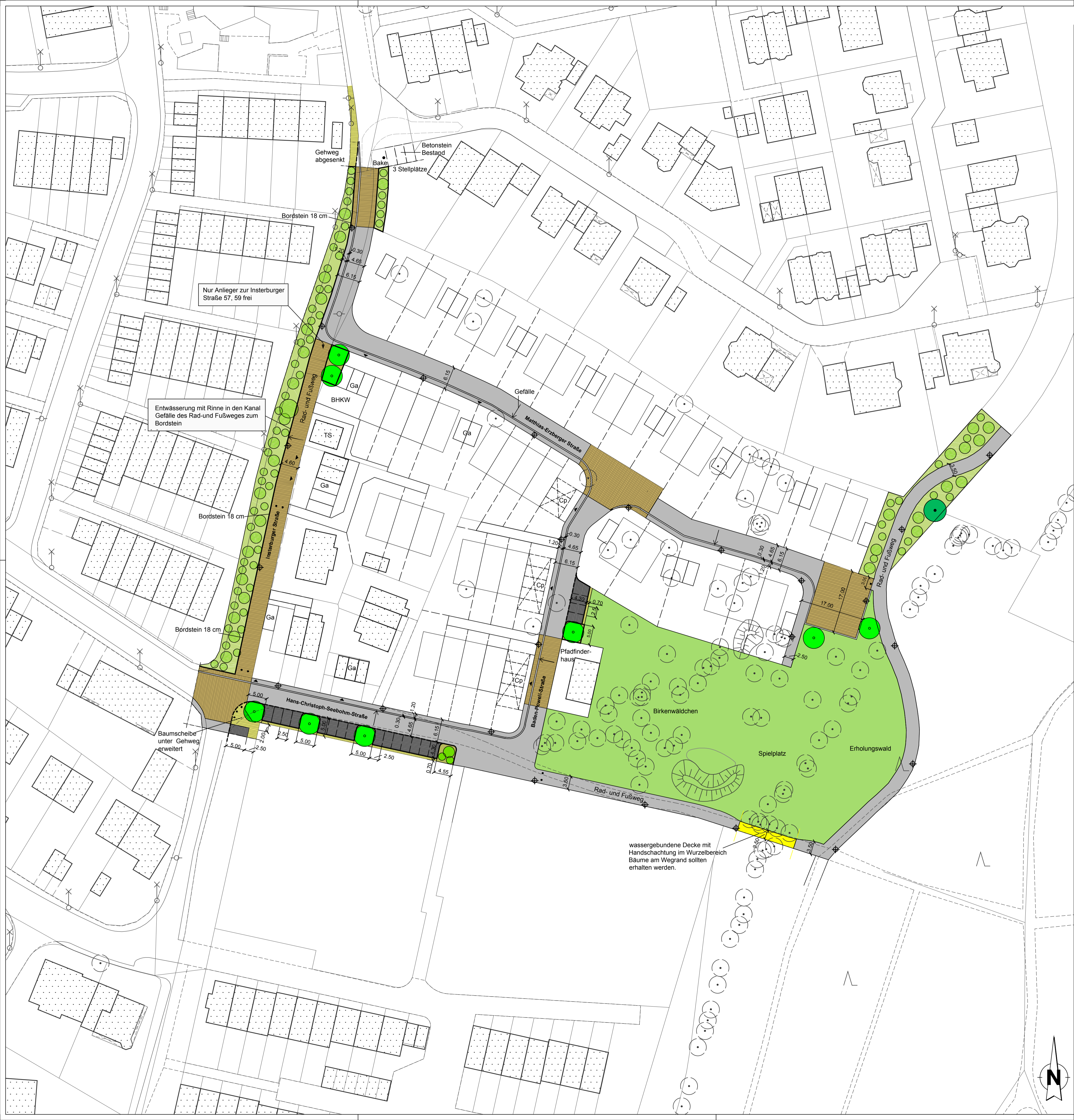
ÜBERSICHTSPLAN M 1:10.000